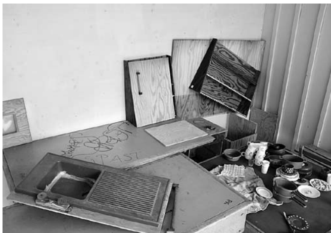
Bild: Wieder eingesammelt - Die Überreste der Küche

Der Gemeinderat hat Strafanzeige gegen Unbekannte eingereicht.